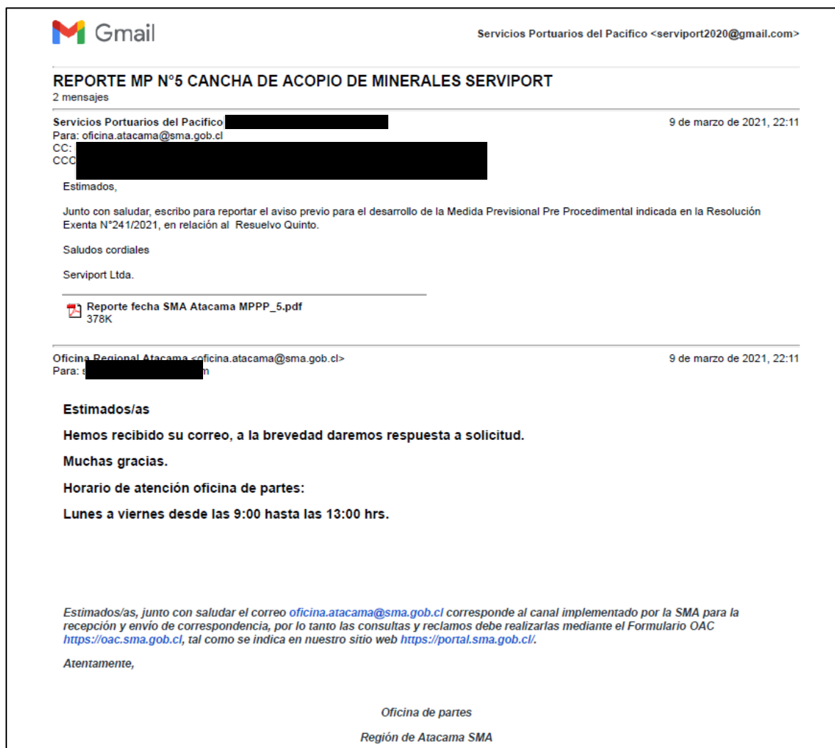
Imagen 3. Aviso previo a OR SMA

En la siguiente imagen, se da cuenta del aviso previo dado a la SMA.