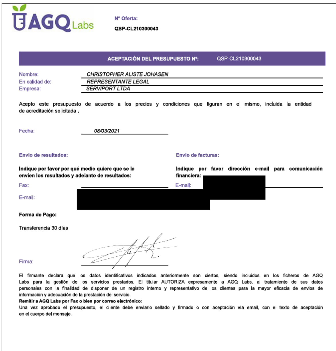
Imagen 2. Aceptación de presupuesto ETFA