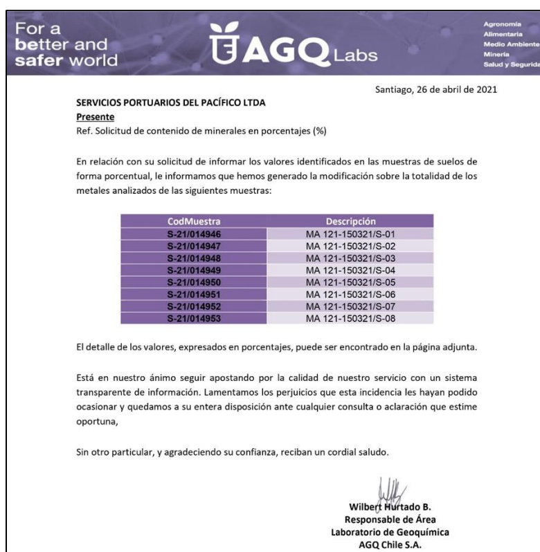
Imagen 5. Fracción Informe ETFA calidad de mineral de hierro

Se adjunta a continuación parte del informe emitido por ETFA y se acompaña como apéndice 1 informe completo.